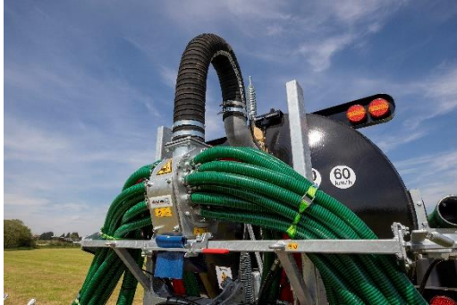
Bild 3: Montiert an einem Fasswagen: der Exaktverteiler ExaCut ECL.