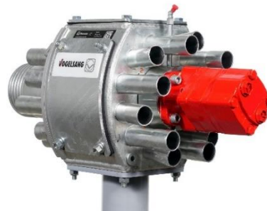
Bild 2: Der Exaktverteiler ExaCut ECM verteilt die Gülle gleichmäßig auf die Ablaufschläuche.