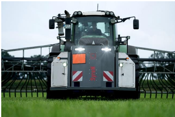
Bild 5: SyreN säuert die Gülle während der Ausbringung mit Schwefelsäure an.