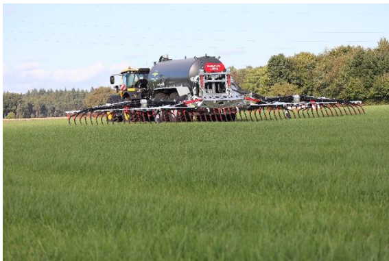
Bild 1: Das Schleppschuhgestänge BlackBird Pro legt die Gülle wurzelnah ab.